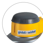
Nuova cover in plastica (L22)