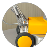
Snodo del manico