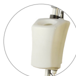
Serbatoio 12 litri (optional)