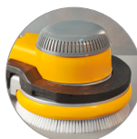
Possibilità uso peso aggiuntivo (optional)