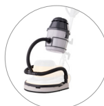
Gruppo aspirante (optional)