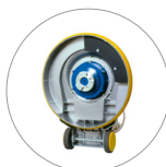
Attacco disco trascinatore e spazzole