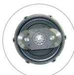
Riduttore a satelliti e planetario (L22)